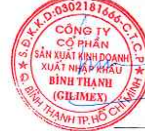
Lê Hùng Chủ tịch HĐQT

Báo cáo này phải được đọc cùng với Bản thuyết minh Báo cáo tài chính